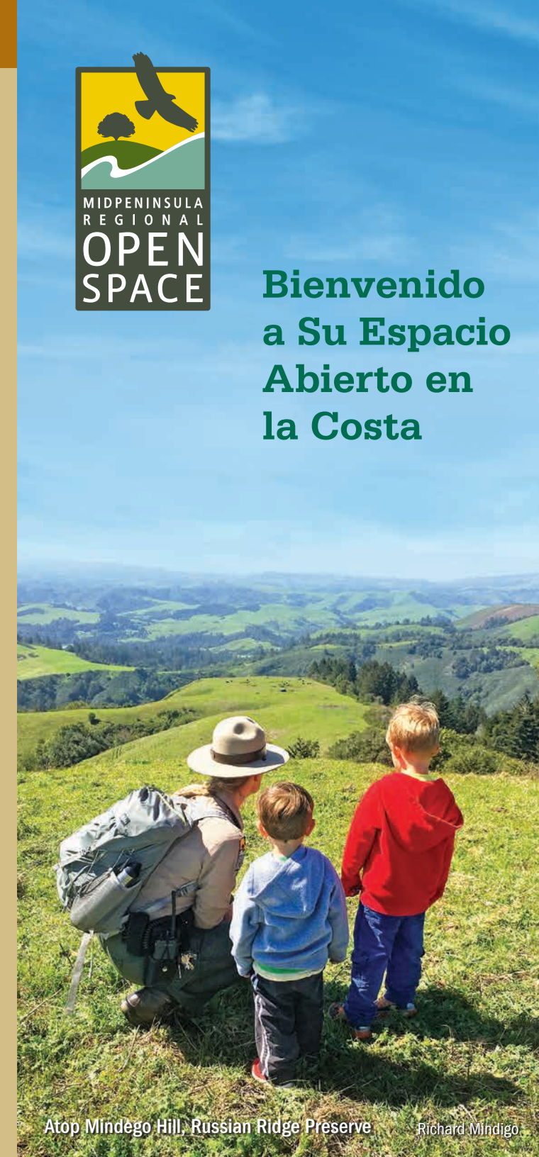
Atop Mindego Hill, Russian Ridge Preserve

Bienvenido a Su Espacio Abierto en la Costa